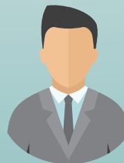
กรรมการที่เป็นผู้แทนสถานศึกษา นำร่องในพื้นที่นวัตกรรมการศึกษา

กรรมการที่เป็นผู้แทนสถาบันอุดมศึกษา ที่มีความเชี่ยวชาญด้านการผลิต และพัฒนาคู