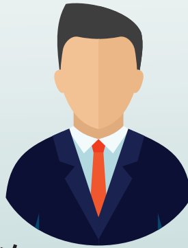
ประธานกรรมการ ผู้ว่าราชการจังหวัดเชียงใหม่