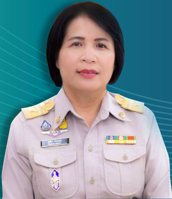
ดร. ยุพิน บัวคอม ศึกษาธิการจังหวัดเชียงใหม่